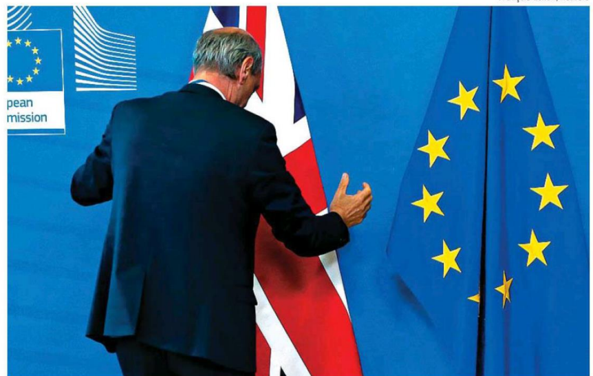
O contexto internacional, marcado por acontecimentos como o Brexit, é uma variável importante na evolução da economia